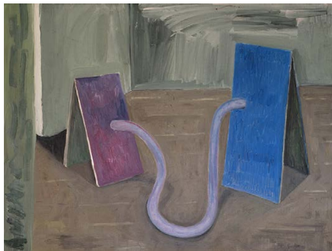
Federico Luger, Colors, 2015, olio su tela, 50 x 70 cm

inaugurazione mercoledì 2 novembre 2016, ore 18.30